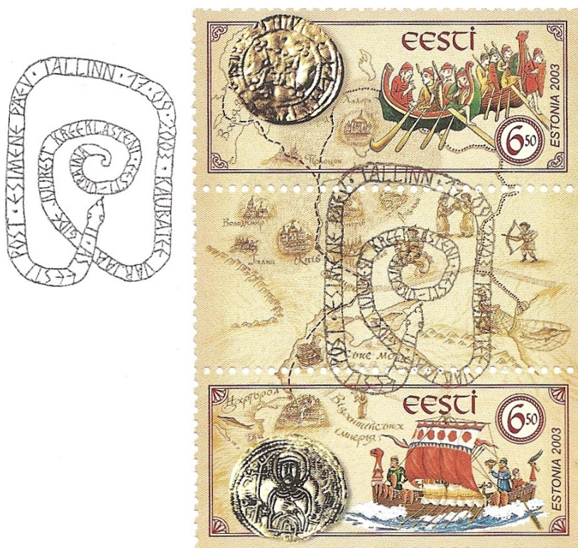
Utsnitt ur estniskt FDC med fristämpel, som visar motiv inspirerad av runslingan i Gripsholmsstenen.

Gripsholmsstenen är den mest kända av de så kallade Ingvarsstenarna. Stenen hittades 1827. Den var då täckt av tjära och låg som tröskelsten i slottet.