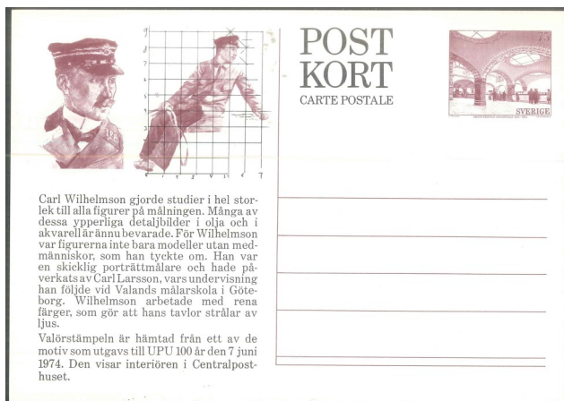
Carl Wilhelmsson gjorde studier i hel stor- lek till alla figurer på målningen. Många av dessa ypperliga detaljbilder i olja och i akvarell är ännu bevarade. För Wilhelmsson var figurerna inte bara modeller utan med- människor, som han tyckte om. Han var en skicklig porträttmålare och hade på- verkats av Carl Larsson, vars undervisning han följde vid Valands målarskola i Göte- borg. Wilhelmsson arbetade med rena färger, som gör att hans tavlor strålar av ljus. Valörstämpeln är hämtad från ett av de motiv som utgavs till UPU 100 år den 7 juni 1974. Den visar interiören i Centralpost- huset.

Postkortet pKe 75 utgavs även i en specialutgåva till Frimärkets Dag 1976 där kortet försetts med sido- vinjett utgörande bilder av Carl Wilhelmssons stu- dier till ett par figurer i fondmålningen i Centralposthuset.