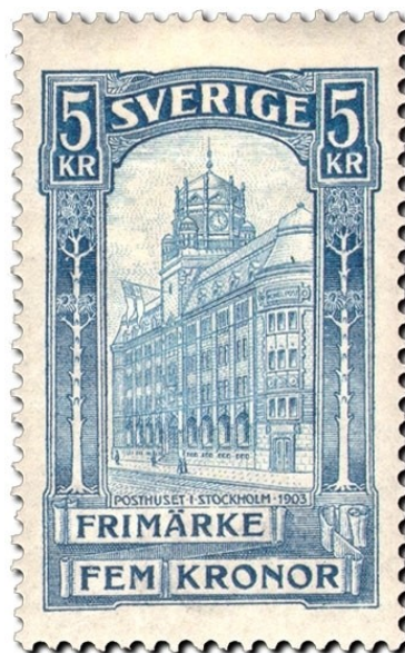
Frimärke nr 65, Sveriges första bildfrimärke 1903

År 1874 samlades representanter för 22 länder – bland dem Sverige – i Bern i Schweiz och undertecknade regler för Världspostförbundet, Universal Postal Union (UPU). Hundraårsminnet av denna