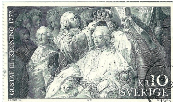
Detalj ur C G Pilos målning "Gustav III krönes" ur häftet Slania 70 år (1991).

Dödsstraffet avskaffades, hälsovården förbättrades och statsförvaltningen blev mindre korrumpierad. Därigenom blev han mycket populär hos folket men skaffade sig en del fiender. En upplyst despot!