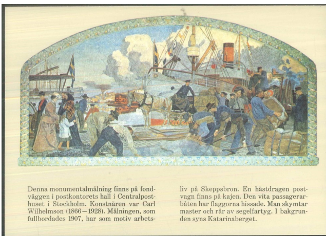
Denna monumentalmålning finns på fond- väggen i postkontorets hall i Centralpost- huset i Stockholm. Konstnären var Carl Wilhelmsson (1866–1928). Målningen, som fullbordades 1907, har som motiv arbets-

tilldragelse uppmärksammades 1974 i många länder med frimärks- utgåvor. Sverige utgav i ett häfte två frimärken (Nr 871 och 872) visande entréportalen till Centralposthuset respektive Centralhallen. Frimärke (nr 872) med interiör centralhallen i centralposthuset åter- användes som värdetecken i Postmusei postkort pKe 75 i oktober 1976. Bildsidan av detta vykortskort- liknande postkort visar ”Skeppsbron Stockholm”, väggmålning 1907 av Carl Wilhelmsson i Centralposthuset.